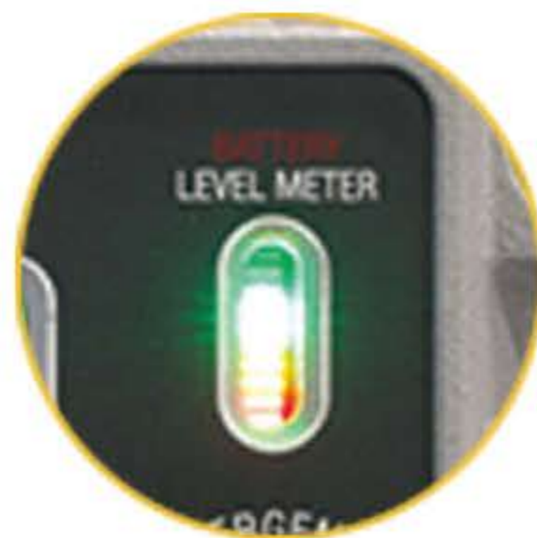
충전 및 배터리 레벨 게이지