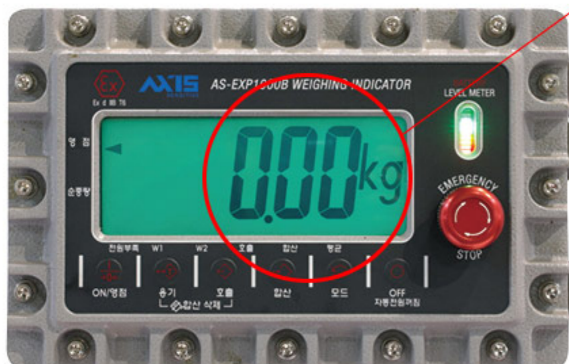
방폭형 충전 인디케이터