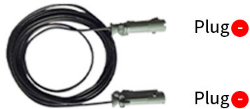
Plug 20A 이하는 사용자 Receptacle 사양에 맞춰 공급 (20A 이상 옵션 사항)