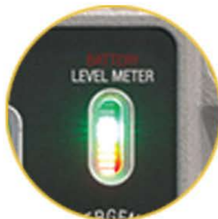
충전 및 배터리 레벨 게이지