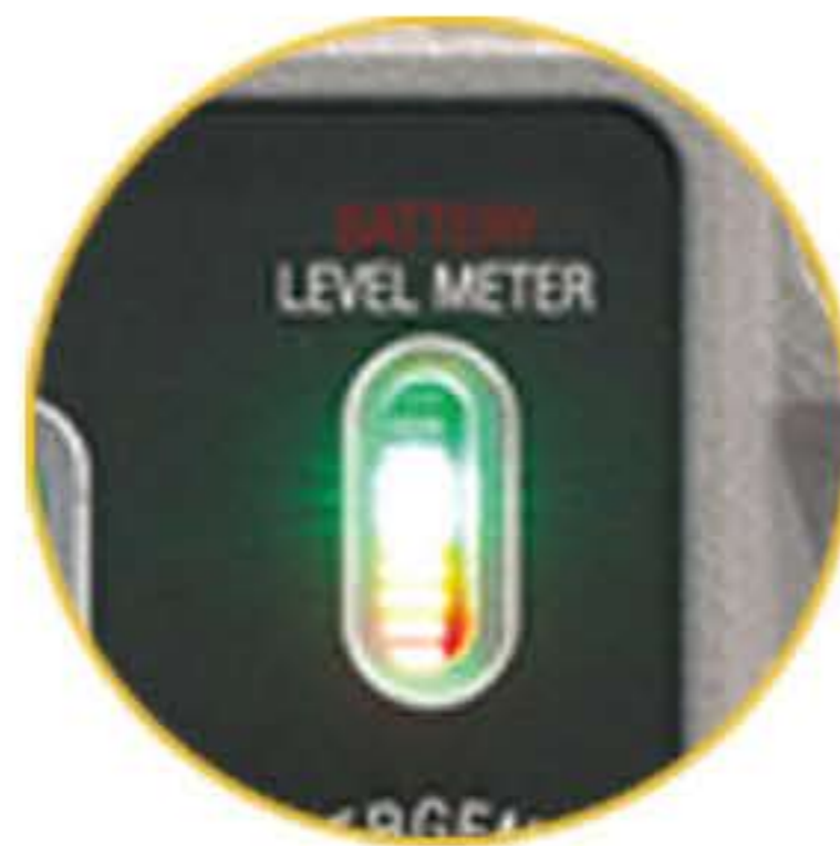
충전 및 배터리 레벨 게이지