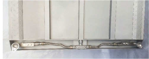
※로드셀 장착 위치 사진