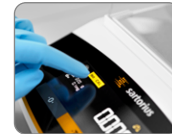
isoCAL 자동 교정