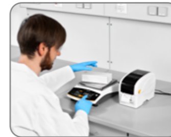
GMP 호환 출력