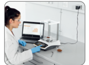
PC 직접 연결 기능 (Plug and Play)