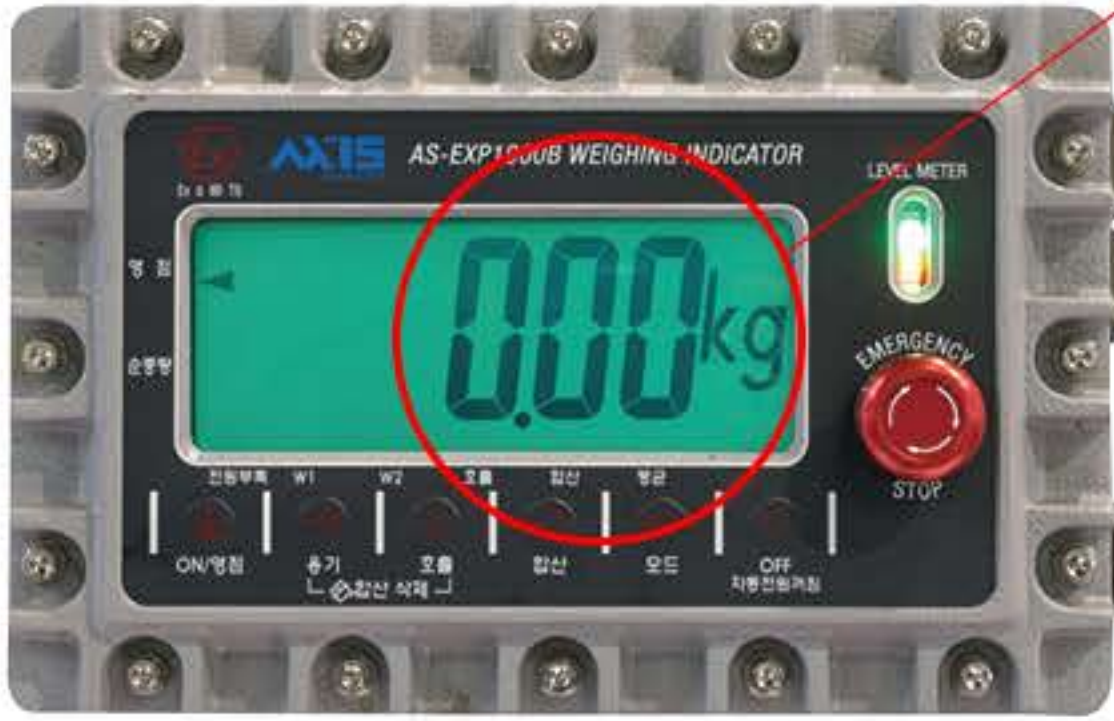
방폭형 충전 인디케이터