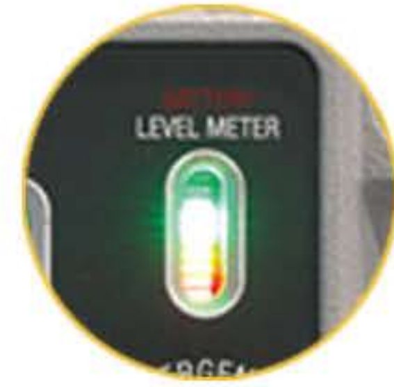
충전 및 배터리 레벨 게이지