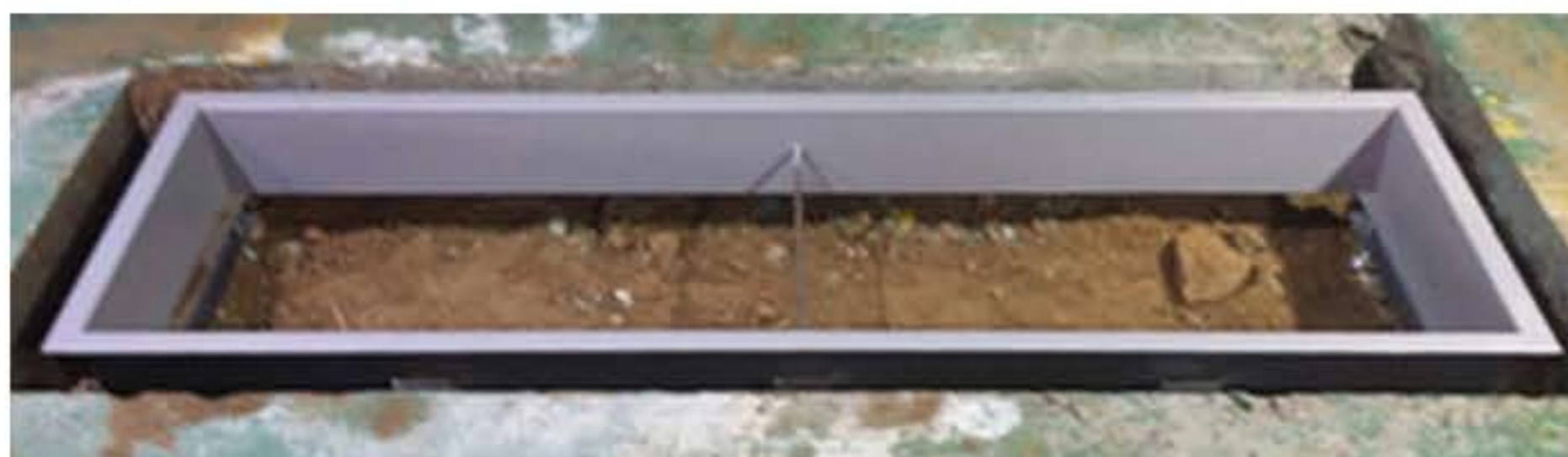
① 터파기 공사 → 토목용 약구 설치