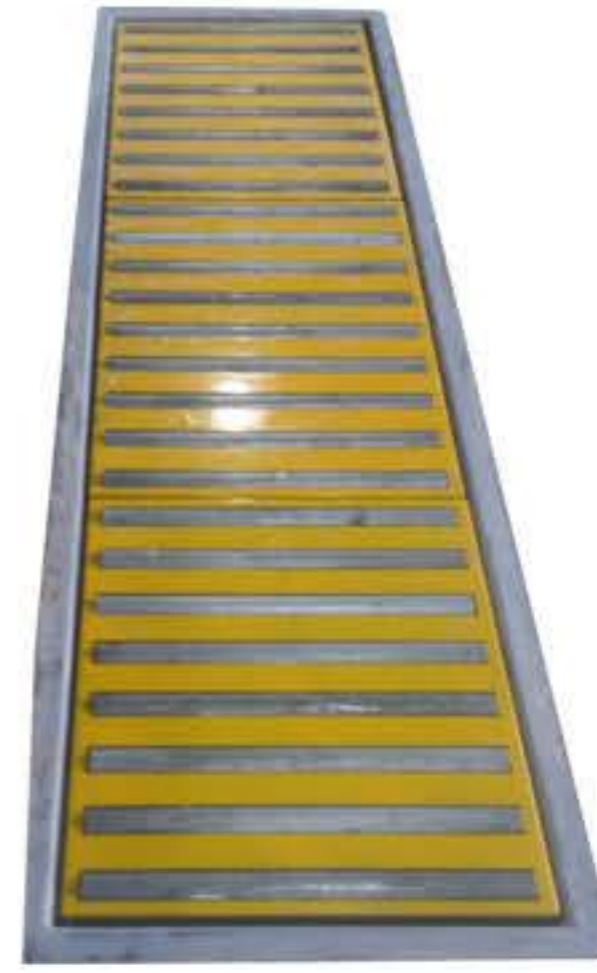
③ AP-EX500AR-IWO 매립