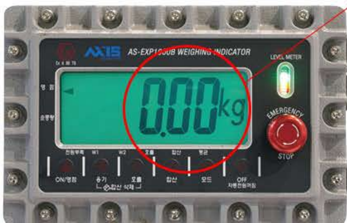
방폭형 충전 인디케이터