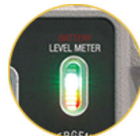
충전 및 배터리 레벨 게이지