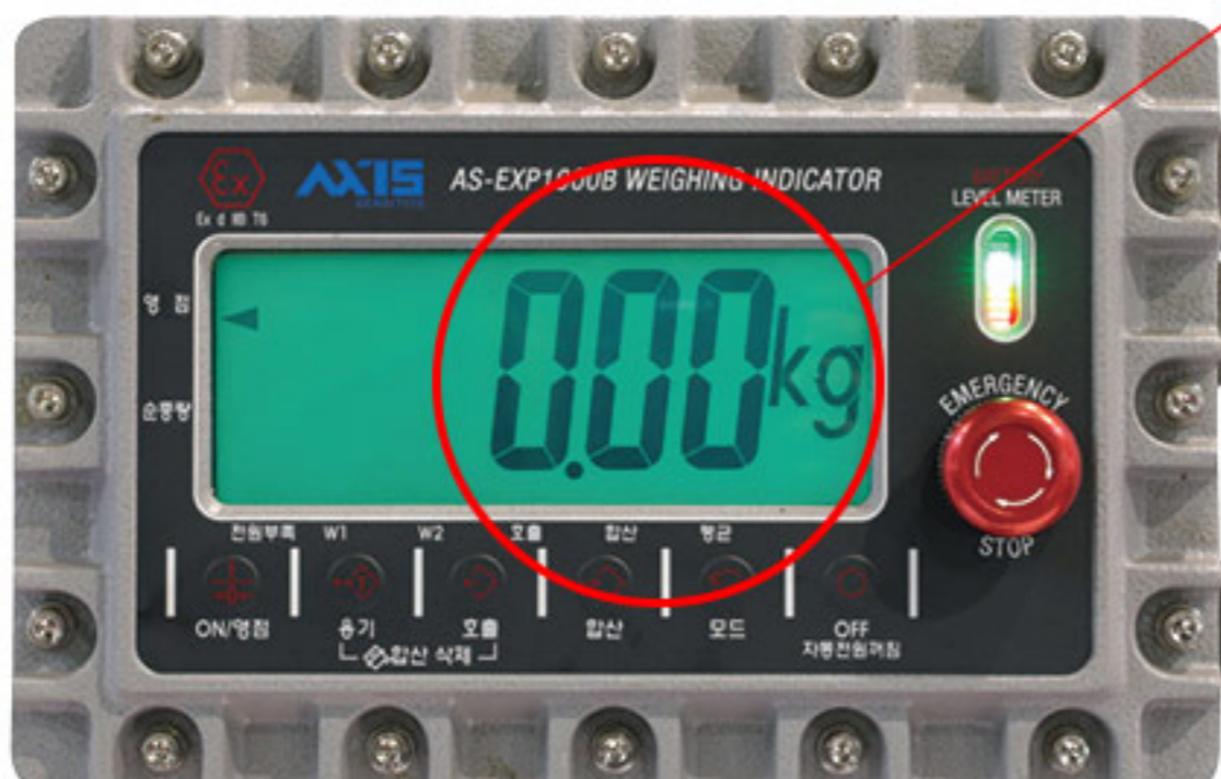
방폭형 충전 인디케이터

Plug 20A 이하는 사용자 Receptacle 사양에 맞춰 공급 (20A 이상 옵션 사항)