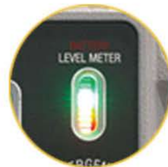
충전 및 배터리 레벨 게이지