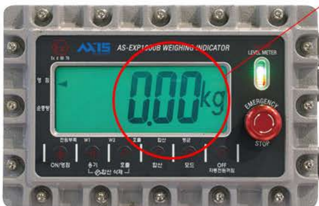
방폭형 충전 인디케이터