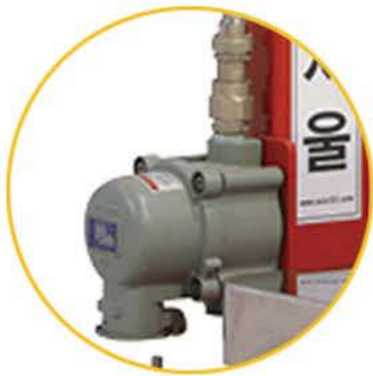
Receptacle+ (AC220V, 20A)