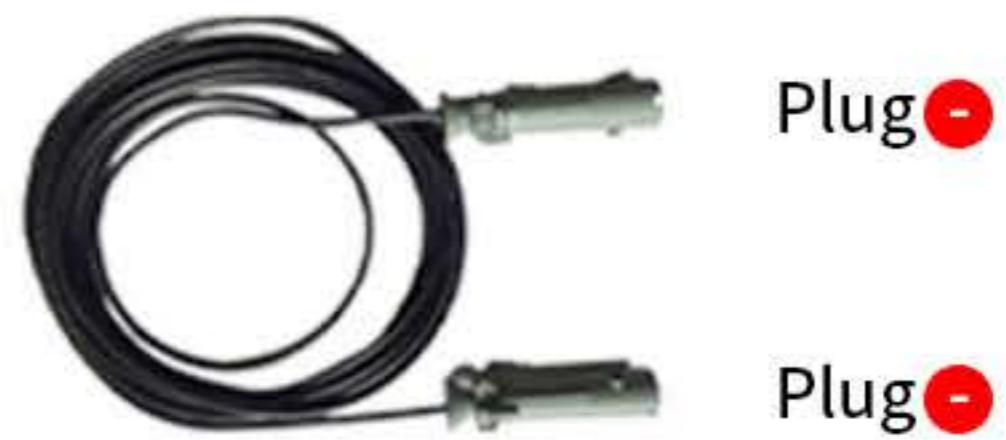
Plug 20A 이하는 사용자 Receptacle 사양에 맞춰 공급 (20A 이상 옵션 사항)